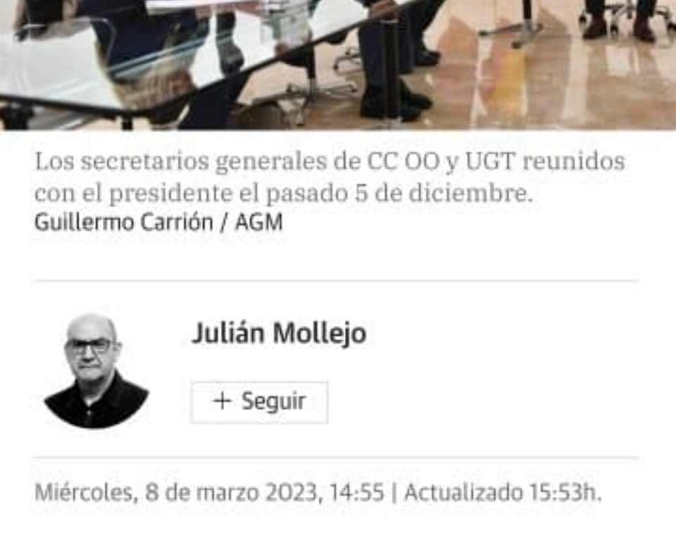
Los secretarios generales de CC OO y UGT reunidos con el presidente el pasado 5 de diciembre.

El Gobierno regional propone que se empiece a aplicar en septiembre, pero los sindicatos UGT y CC OO insisten en que debería ser a partir de junio